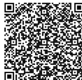
QR Код поиск маршрутов

* В автобусах и поездах обязательно ношение масок FFP2 типа.